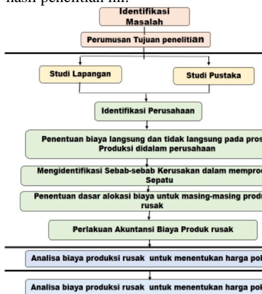
Gambar 4.1 : Tahap Tahap dalam Penelitian