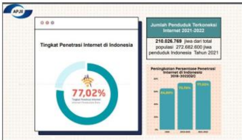
Gambar 1 Penetrasi Penggunaan Internet di Indonesia