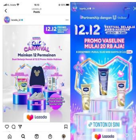
Gambar 5 Contoh Social Media Marketing Pada Lazada