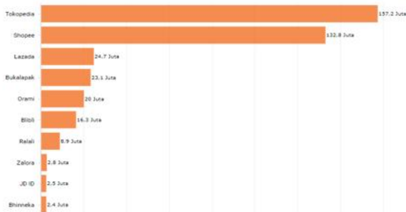
Gambar 2 Diagram 10 E-Commerce di Indonesia Pada Kuartal III 2019